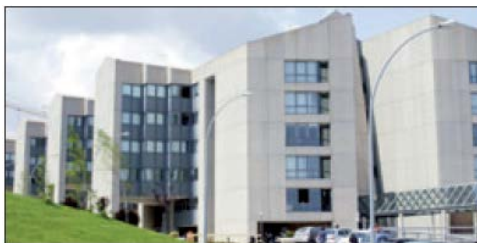
L'Ateneo molisano si è posizionato al 45° posto, superando università prestigiose.

L'Università degli Studi del Molise guadagna altre quattro posizioni in classifica